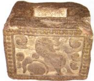
ภาพโบราณวัตถุที่ค้นพบบริเวณเมืองโบราณกำแพงแสน