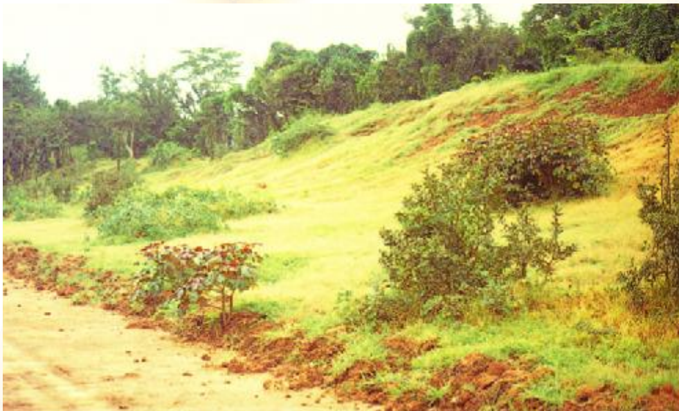
ภาพคันดินรอบเมืองโบราณกำแพงแสน สูง ๔ เมตร