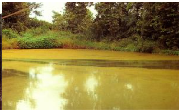
ภาพสระน้ำภายในเมืองโบราณกำแพงแสน