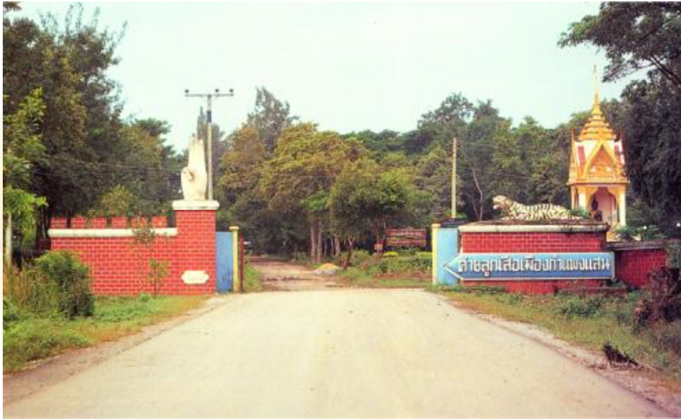
ภาพทางเข้าเมืองโบราณกำแพงแสนด้านทิศตะวันออก (ปัจจุบันใช้เป็นค่ายลูกเสือ)