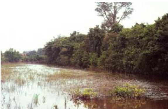
ภาพคูน้ำล้อมรอบเมืองโบราณกำแพงแสน

จากการตรวจและทำแผนผังเมืองโบราณกำแพงแสนของกรมศิลปากร พบว่า ภายในตัวเมืองมีลักษณะเป็นเนินอยู่หลายแห่ง มีสระน้ำเป็นรูปเหลี่ยม ๒ แห่ง มีคูน้ำชั้นในเกือบเป็นรูปกลม อยู่เชิงไปทางส่วนตะวันออกเฉียงเหนือของใจกลางเมืองไม่ปรากฏซากโบราณสถานภายในเขตตัวเมือง ส่วนโบราณสถานที่พบอยู่ห่างจากกำแพงเมืองโบราณออกไปประมาณ ๑๒๐ เมตร มีลักษณะเป็นเนินอิฐประมาณ ๓ - ๔ เนิน ตั้งเรียงรายกันเป็นระยะ ๆ ไป เนินอิฐเหล่านี้เข้าใจว่าคงจะเป็นฐานเจดีย์เล็ก ๆ นอกจากนั้น ชาวบ้านยังขุดพบพระพุทธรูปดินเผาพอกปูนสูงประมาณ ๕๐ เซนติเมตร ๒ องค์ เศียรพระพุทธรูปปูนปั้น รูปบุคคล และรูปสัตว์ที่ทำจากดินเผา จำนวนหนึ่ง ซึ่งโบราณวัตถุเหล่านี้เป็นงานศิลปะที่ใช้ดินเผาเป็น โกลนพอกทับด้วยปูน เป็นรูปแบบศิลปกรรมที่อยู่ในสมัยทวารวดี