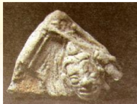
ภาพดินเผาในลักษณะต่างๆ ที่พบในเมืองโบราณจันเสน