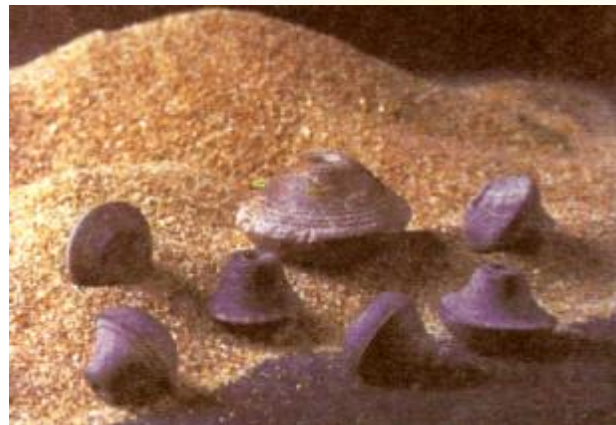
ภาพแวนดินเผา พบที่เมืองโบราณจีนเสน

โบราณวัตถุที่ขุดพบมีมากมาย ได้แก่ ไหที่ตกแต่งลวดลายประทับลงไปเป็นรูปต่างๆ เช่น ม้าที่มีคนขี่ ช้าง หงส์ วัว นักรบ ฯลฯ ลักษณะของไหก็มีหลายชนิด รอบๆ ปากไหมีแถบสีแดงและสีขาว นอกจากนั้นยังพบศิลปวัตถุดินเผาอีกเป็นจำนวนมาก ลักษณะเครื่องปั้นดินเผาชิ้นแรกๆ ของจีนเสน (ประมาณ พ.ศ. ๑๓๔๓ - ๑๕๕๓) จะเผาไฟแก่อ่อนไม่สม่ำเสมอ บางทีอาจเผาในที่กลางแจ้ง ในระยะหลังนั้นเครื่องปั้นดินเผาของจีนเสนเผาในเตาอย่างแท้จริง จึงมีสีสม่ำเสมอ เช่น เศษภาชนะดินเผารูปดอกบัว เศษภาชนะดินเผารูปคนขี่ม้า ชิ้นส่วนดินเผารูปสัตว์ ตุ๊กตาดินเผารูปวัว หมอบ แผ่นดินเผารูปไข่ที่มีลวดลายก้านขด ตุ๊กตาดินเผารูปบุรุษและสตรี ในลักษณะต่างๆ รวมทั้งแวนดินเผาขนาดต่างๆ พระพิมพ์ดินเผารูปต่างๆ โดยเฉพาะพระพิมพ์พระพุทธรูปปางแสดงธรรม หรือปางวิตรรกะ ซึ่งเป็นลักษณะของศิลปะสมัยทวารวดี นอกจากนี้ยังพบห่วงสำริดประดับลวดลาย ลูกปัดแก้วสีต่างๆ อาวุธต่างๆ เช่น ขวานสำริด หัวธนูทำด้วยเหล็ก แวทำจากงาช้างและตะกั่วสมัยทวารวดี แทนและที่บดทำด้วยหินซึ่งมีร่องรอยการใช้งานอย่างหนัก พบเป็นจำนวนมากในบริเวณเมืองโบราณจีนเสน